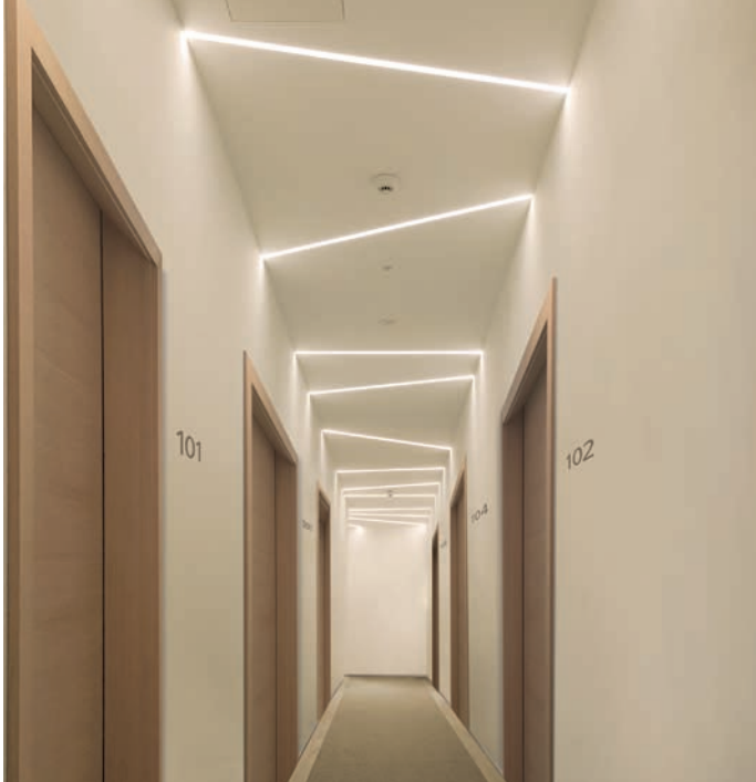
Abb.: Die Lichtlinien verbreitern optisch die Hotelflure und erfüllen zudem eine leitende Funktion, da sie auf die Zimmernummern hindeuten.